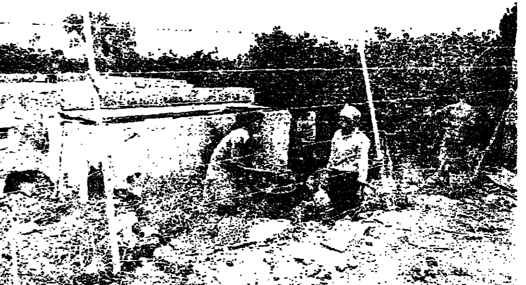
الماء يستعمل للشرب والسيول واحد في وقت